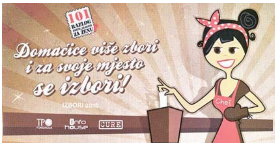
Slika br. 7.3. Kampanja „101 razlog zašto glasati za ženu“ 691