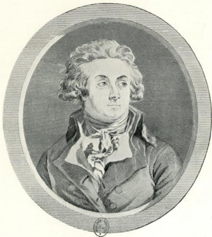
HÉRAULT DE SÉCHELLES