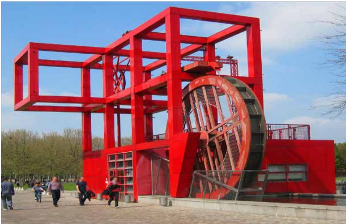
Bernard Tschumi, Parc de la Villette , Paris, 1982-1998.