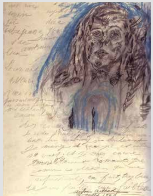
Antonin Artaud, crtez , 1947.

Ključne reči: vizuelni tekst, drugo, parergon, subjectile, liminalno, trag, pisanje, Derida