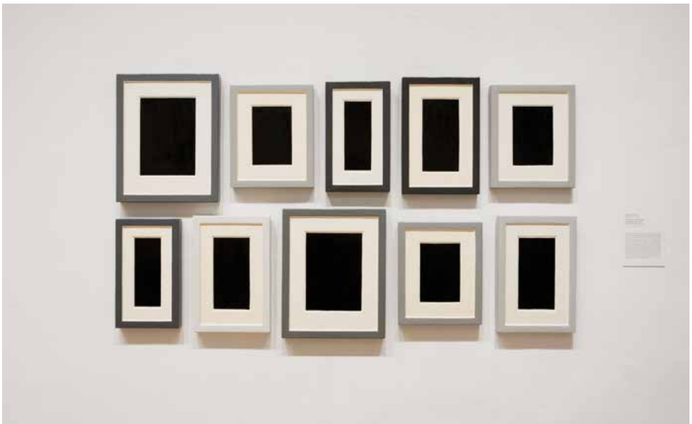
Allan McCollum_Plaster Surrogetes_1982-83 (sl.3)

Polazeći od Kantovog određenja, Derida piše da je perargon atopičan jer ne predstavlja ni delo (ergon) ni materiju izvan dela, „ni unutar ni spolja, ni iznad ni ispod“ već sam rub koji odvaja delo od njene eksteriornosti. Samim tim, Derida naglašava, perargon je „osuđen“ da se „uvek već deli na dva“. Premda učestvuje u smeštanju dela ili bolje reći smešta delo, poput subjectile ili maintenant, perargon ipak, za razliku od ovih figura-pojmova, ne ostaje neodređen. Parargon ne ostaje neodređen zato što „ne pada sa strane“, jer se nalazi baš na samoj granici, na samom rubu. Kao takav, on je blizak zamisli subjectile, imajući u vidu da je graničan pojam, ali dok subjectile anticipira predstavu „iz podloge“ (ekran) kao medijatorni prostor koji treba biti perforiran, na kome i u kome treba dejstvovati, kao ono što je podrška i povlači se nakon činjenja, perargon je uvek tu da ide „protiv sa strane i pored ergona“; perargon uokviruje, (sl. 3) za razliku od subjectile koji u vidu podrške samo omogućava generisanje vizuelne predstave. Čini se da se perargonom pokušava odgovoriti na pitanje „šta je to?“, jer, „pitanje šta je? konstruiše okvir koji prisvaja energiju onoga što je u potpunosti neasimilujuće i apsolutno potisnuto.“ 1 Subjectile pak samo omogućava vizuelni tekst a ponekada čak može ponuditi odgovor na pitanje „kako“?