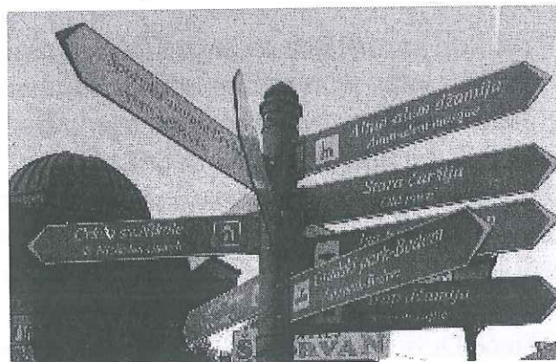
Slika 1. Turistička pokazna tabla u Novom Pazaru, pored Sebilja. 1

Primjer znaka turističke putokazne table dat je na slici 1, koji sadrži uporedo natpis na srpskom i na engleskom jeziku. Kao što se vidi sa slike 1, više turističkih putokaznih tabli postavljeno je na jedan, zajednički stub, i u skladu sa gore navedenim priručnikom, sve table su jednakih dimenzija (Ibid 106).