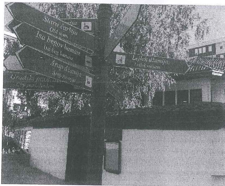
Slika 2. Turistička pokazna tabla u Novom Pazaru, ispred Muzeja „Ras”.

Kao što se može vidjeti sa slike, ova pokazna tabla se nalazi u samom centru Novog Pazara i postavljena je u novije vrijeme, tj. 2012. godine. Time se pokazuje da je uticaj engleskog jezika u ovom segmentu kulture ovog grada skorijeg datuma. U Novom Pazaru se nalaze još dvije ovakve pokazne table, i to ispred gradskog Muzeja „Ras” (Slika 2) i ispred Bedema 2 , na samom mostu (Slika 3). Sve tri pokazne table istih su oznaka i pokazuju pravce ka najpoznatijim islamskim i hrišćanskim kulturno-historijskim spomenicima u Novom Pazaru.