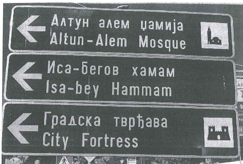
Slika 5. Islamski kulturno-historijski spomenici u Novom Pazaru.