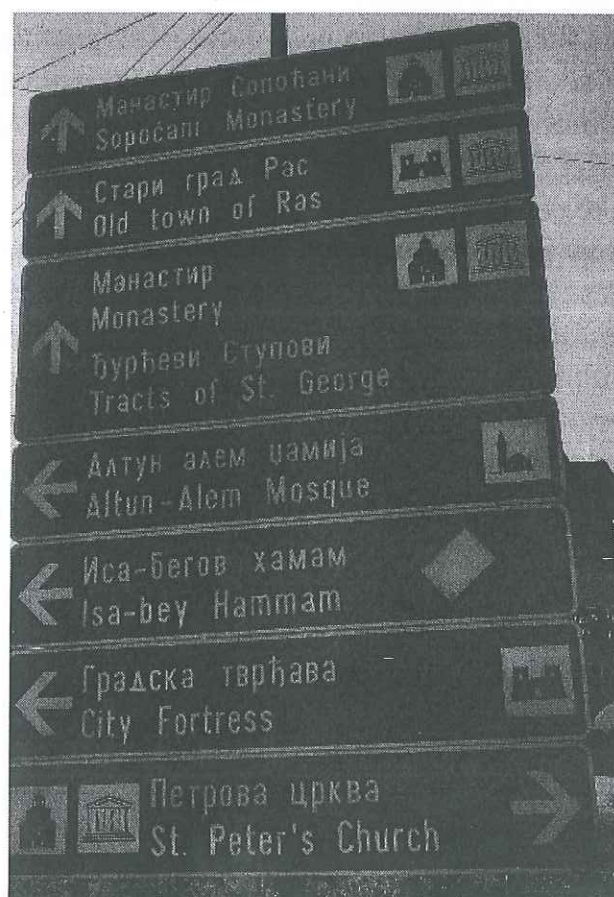
Slika 6. Hrišćanski kulturno-historijski spomenici u Novom Pazaru. 3