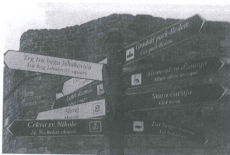
Slika 3. Turistička pokazna tabla u Novom Pazaru, ispred Bedema.