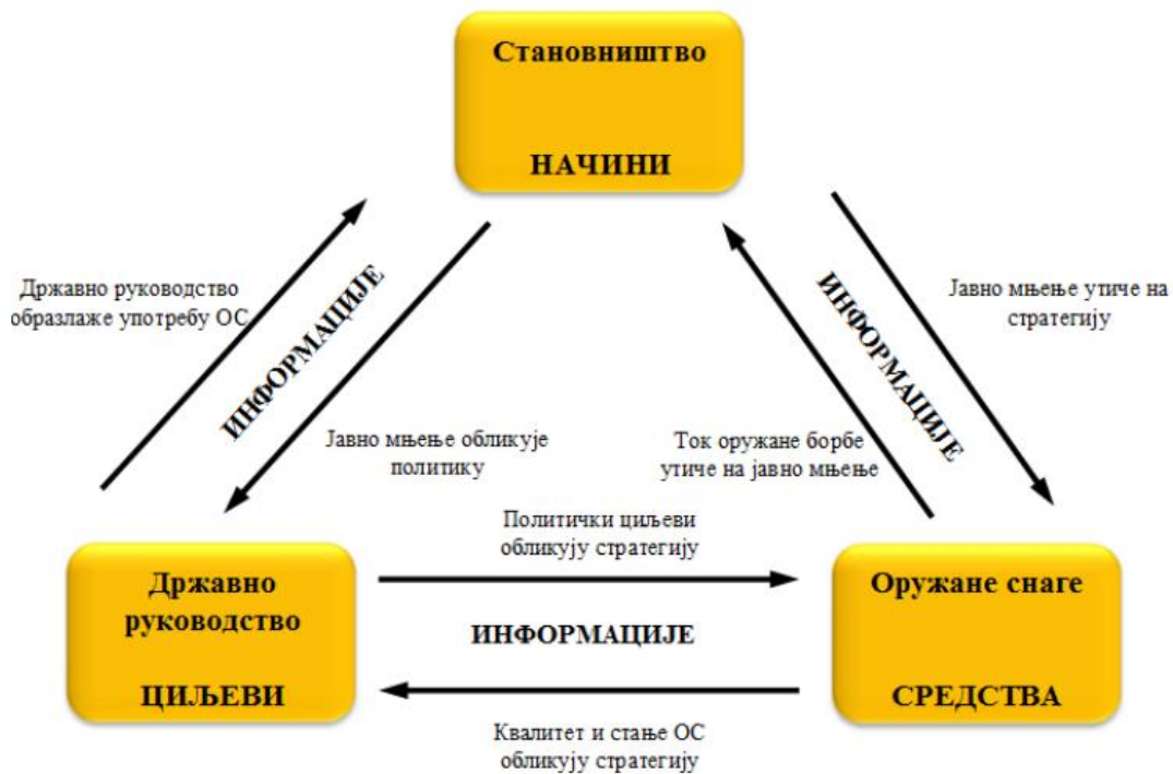
Слика 2: Однос начина, средстава и циљева у хибридном сукобу

Како постају све мање видљиве границе између рата и мира у класичном смислу, као и лица која носе униформу и оних који прикривено делују, и како се ратови више не објављују без јасно одређених догађаја које би означиле правилност, као карактеристике хибридног рата можемо одредити следеће (Banasik, 2015):