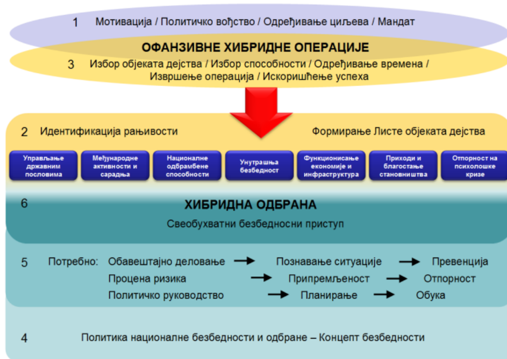
Слика 3: Планирање и припрема хибридног напада

Узимајући у обзир мишљења одређених стручњака, можемо закључити да концепт хибридног ратовања подразумева три основне фазе, при чему се свака фаза састоји од три подфазе. Ове фазе су: фаза припреме, фаза напада и фаза стабилизације. У наставку ћемо детаљно објаснити активности сваке фазе. (Милошевић, 2018)