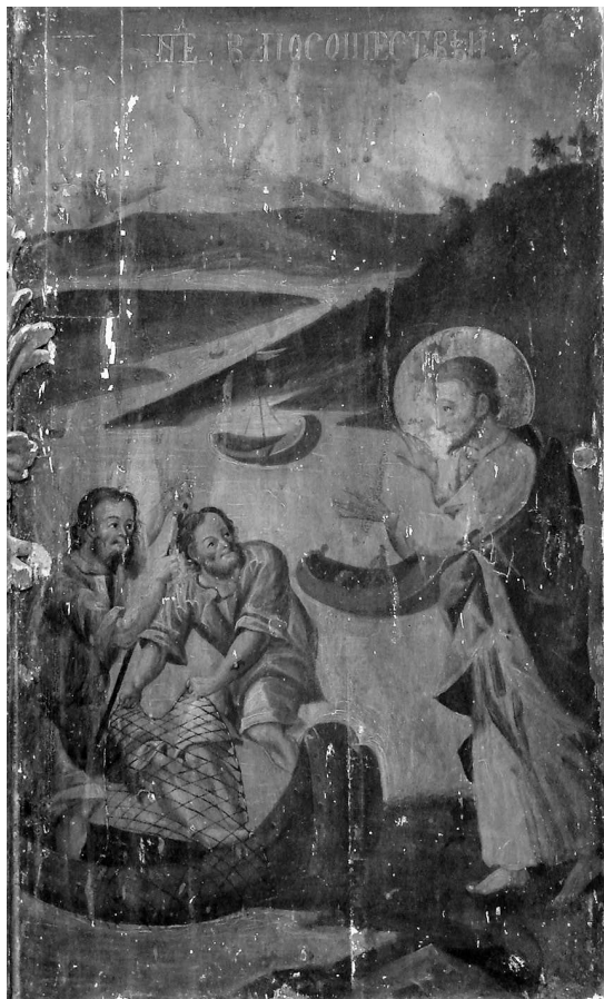
Сл. 3 - Василије Романовић, Христос и два рибара , Црква светих Петра и Павла у Доњим Граховљанима, 1761