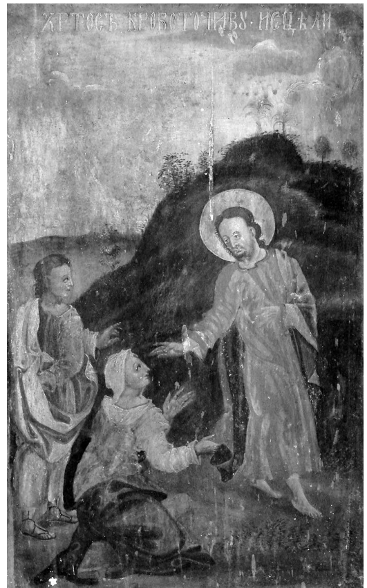
Сл. 2 - Василије Романовић, Исцељење крвојочиве жене , Црква светих Петра и Павла у Доњим Граховљанима, 1761