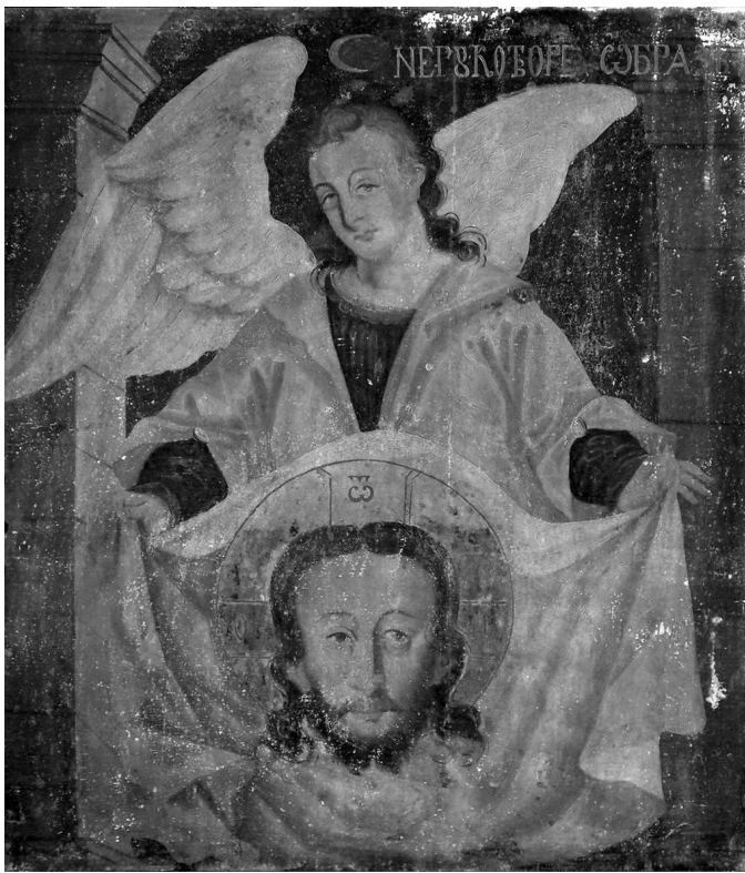
Сл. 1 - Василије Романовић, Мандилион , Црква светих Петра и Павла у Доњим Граховљанима, 1761