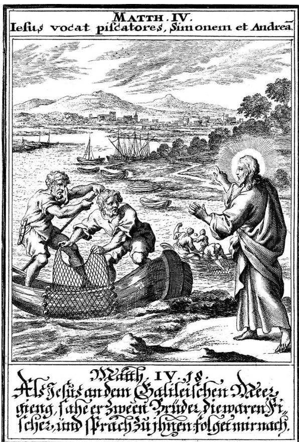
Сл. 4 - Biblia Ectypa, Христос и два рибара , 1695