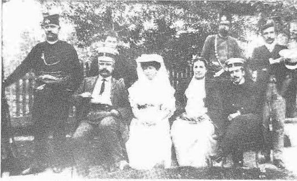
7. Петар Петровић, Српски конзул Милан Пећанац са особљем конзулата у Приштини