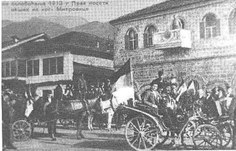
3. Аноним, После ослобођења 1913. године, прва посета у Косовској Митровици