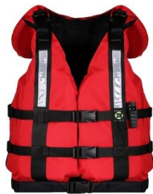
(Slika 11) Sigurnosni prsluk.

- Prsluk (slika11) - Svi učesnici su obavezni da koriste prsluk prilikom raftinga. Prsluk dosta podseća na standardene prsluke koji se dobijaju prilikom krstarenja brodom, međutim ovo je prsluk specijalno napravljen za ekstremne vode i osigurava plovnost odnosno nemoguće je potonuti pri eventualnom ispadanju iz čamca.