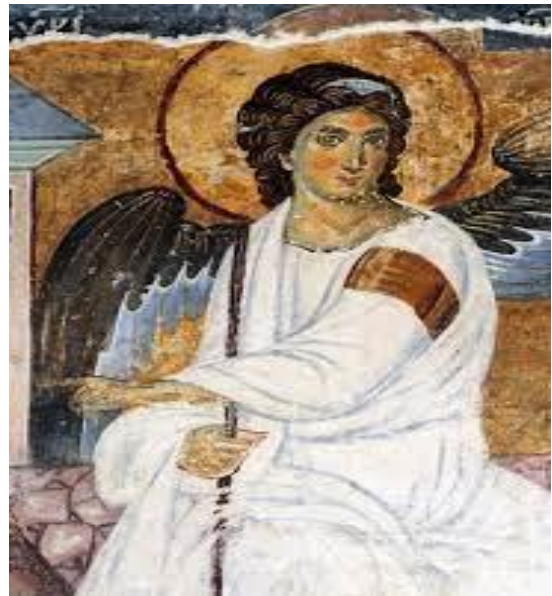
(slika8) Freska Beli Anđeo.