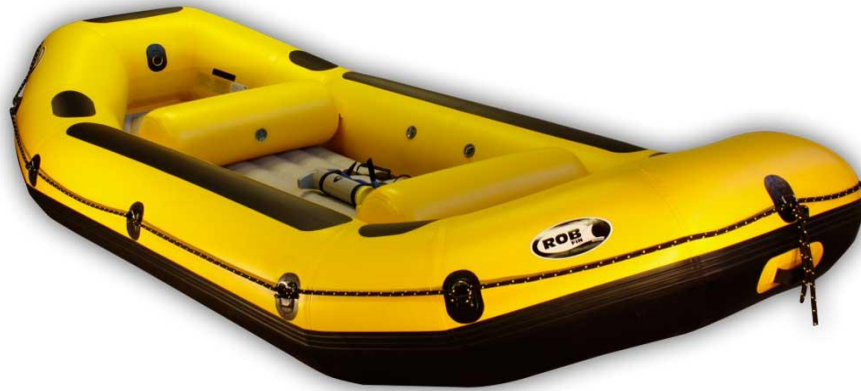
(Slika10) Raft (gumenjak).

Rafting je podeljen u šest klasa prema težini. To su: