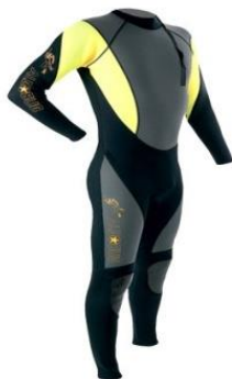
(slika13) Neoprensko odelo.

-Neoprenska odela (slika13)- Nisu obavezan deo opreme ali savetuje se da se obuče. Primarna uloga odela je da štiti od hladne vode. Napravljena su od specijalnog materijala – neoprena. Neoprenska odela nisu nepropusna, naprotiv ona propuštaju malu količinu vode koja se potom zbog toplote tela zagreje i pravi neophodnu izolaciju od hladne vode.