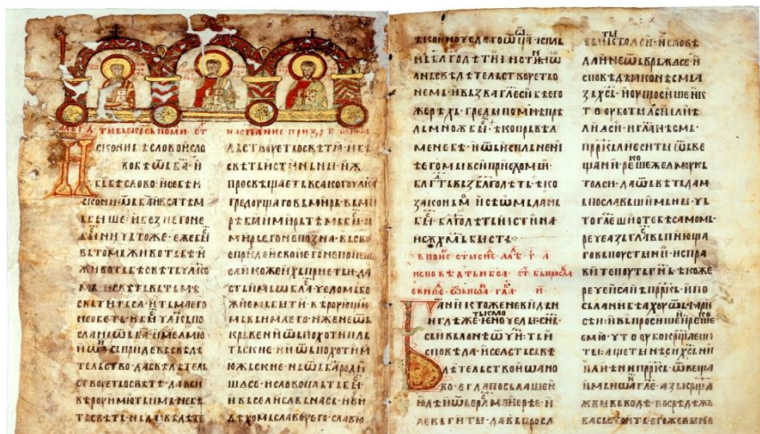
(slika6) Miroslavljevo jevanđelje.

Potiče s kraja 12. veka, a njegov ktitor je knez Miroslav, rođeni brat velikog župana Stefana Nemanje. Za ovu crkvu je napisano čuveno Miroslavljevo jevanđelje (slika 6), najstarija sačuvana ćirilična knjiga kod Južnih Slovena (eparhija.me).