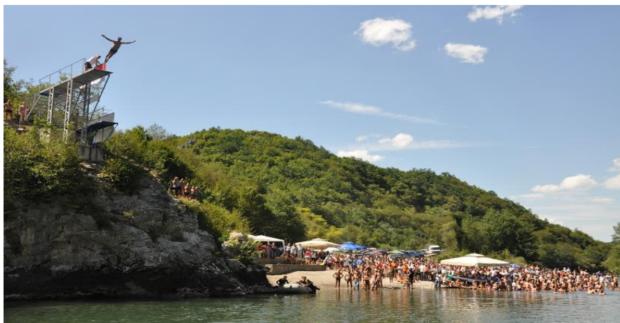
(slika19) Memorijal Pajo Potežica

Memorijal Pajo Potežica (slika19) – Skokovi u vodu koji se održavaju avgustom u Prijepolju. Od 2007. godine ova manifestacija nosi ime posvećeno čoveku koji je svojim entuzijazmom uspeo da okupi poznate skakače i doprinese razvoju plaže Petrovac u Prijepolju.