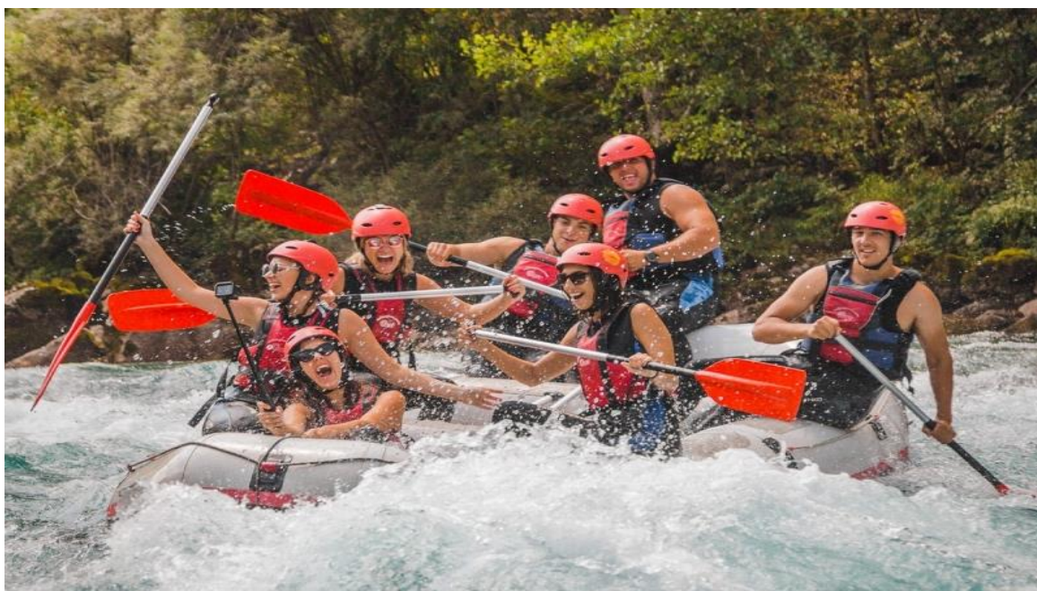
(slika 20) Provod na raftingu.

juna je nivo vode viši, a brzaci su češći i snažniji. Spust je mnogo kraći sa većom količinom adrenalinskog naleta. Sigurnost je primarna, pored opreme, ona u najvećoj meri zavisi od skipera i njegovog poznavanja reke. Skiperi moraju biti licencirani, poznavati teren, odnosno imati dovoljno iskustva na divljim vodama. Reka Lim je idealna za one koji žele da se oprobaju u raftingu, bilo da je u pitanju komercijalni ili takmičarski rafting. Njegovi kanjoni su urezani u visoke stene prekrivene šumom stvarajući prizore za uživanje. Brzaci podižu nivo adrenalina, a nakon njih sledi miran deo toka koji smiruje i prepušta lepim prizorima okoline.