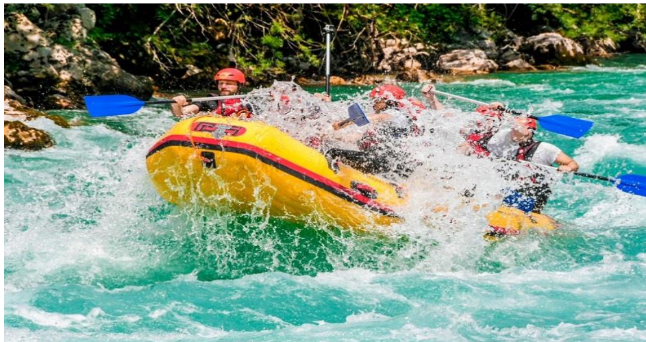
(slika9) Rafting avantura.

Današnji rafting je uzbuđljiva, avanturistička aktivnost u kojoj se učesnici na gumenim čamcima, uz pomoć vodiča – skipera spuštaju niz brzake uzburkanih reka(slika9).