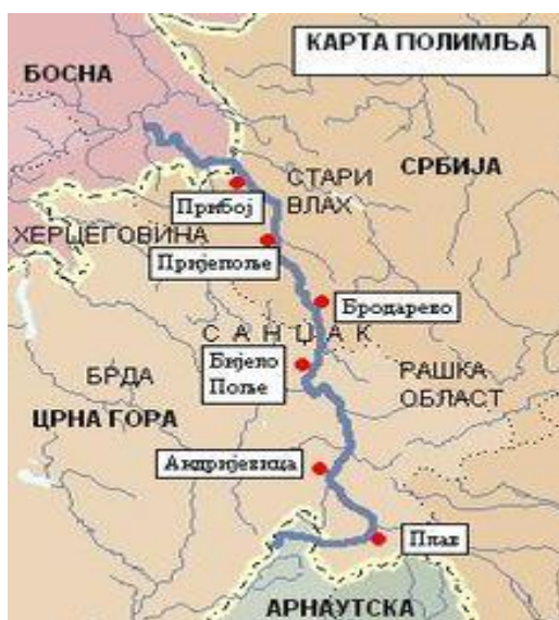
(slika5) Karta Polimlja.

Polimlje je geografska i istorijska oblast koja se nalazi u slivu reke Lim. U Polimlje spadaju područja opština kroz koje prolazi tok reke (slika 5). Centri ove oblasti su: Priboj, Prijepolje, Brodarevo, Bijelo Polje, Berane, Andrijevica i Plav. Tokom ranog srednjeg veka, celokupno Polimlje je bilo u sastavu tadašnje Kneževine Srbije, a tokom 11. i 12. Veka Priboj i Prijepolje, odnosno Polimlje bili su sastavni deo Raške i jedan od središnjih delova rane Nemanjićke države. Podeljeno je na gornje i donje Polimlje. U sastav donjeg Polimlja ulazi Priboj i Prijepolje koji se nalaze na teritoriji Srbije, kao i opština Rudo koja pripada Republici Srpskoj. Stanovništvo Polimlja je etnički i verski mešovito. Prema etničkoj podeli, na području Polimlja žive: Srbi, etnički Crnogorci, Bošnjaci, Muslimani, Albanci, Romi i drugi (Bakić, 2005). Prema verskoj podeli, na području Polimlja žive: pravoslavci i muslimani, kao i manji broj katolika.