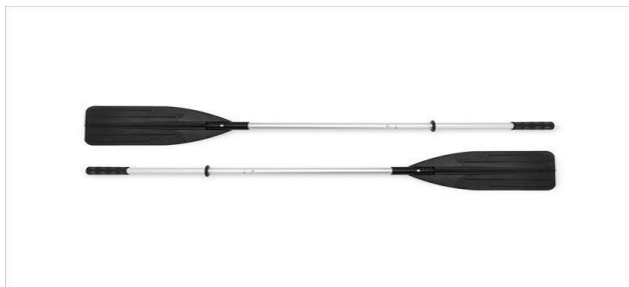
(slika15) Vesla za rafting

-Vesla za rafting (slika15) - Vesla se najčešće izrađuju od pvc-a, ali naravno tu su i drugi materijali kao što je karbon, aluminijum ili kako se to nekad pravilo od drveta. Standardna dužina vesla je oko 1,60 m.