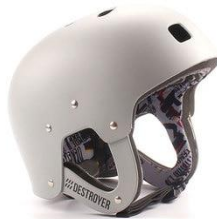
(slika12) Zaštitna kaciga.

- Kaciga (slika12) - Obavezan deo opreme. Zaštita od eventualnih udaraca u glavu. Napravljene od elastične plastike i postavljene voodotpornim sunderom.