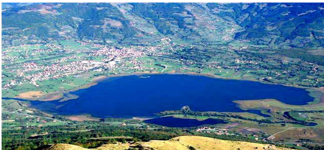
(slika4) Plavsko jezero.

klisura. Izlazeći iz Bijelog Polja, na raskrsnici kod Ribarevina, tabla upućuje levo za Berane. Dalje se nastavlja ka Andrijevici, mestu smeštenom na glacijalnoj terasi Lima, koje je dobilo ime po obližnjoj crkvi. Iz ove varošice, dolinom Lima, stiže se do mesta Murino, a nastavljajući dalje odatle, na 11. kilometru se stiže u Plav. Kotlina Plava i Plavskog jezera predstavlja dragulj Crne Gore. Tu se nalaze brojni izvori i kraško vrelo Oko, čija voda formira poznati vodopad Skakavac. Okružena Prokletijama, reka Lim je pronašla svoje izvorište u jednom od najlepših planinskih krajeva(slika4). Pored njenih prirodnih lepota, reka Lim je svedočila dugoj istoriji tokom koje su nastala drevna naselja i mnoštvo kulturno-istorijskih spomenika u vidu crkava, manastira, džamija, srednjovekovnih građevina. Geografska i istorijska oblast koja prati sliv reke Lim se naziva Polimlje.