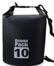
(slika16) Nepropusna vreća

-Nepropusna vreća (slika16) - Preporuka je da se na rafting ne nose skupocene stvari i predmeti koje voda može da ošteti. Ukoliko se takvi predmeti nalaze na čamcu, postoji hermetički zatvorena vreća koja sprečava oštećenja koja voda može da prouzrokuje.