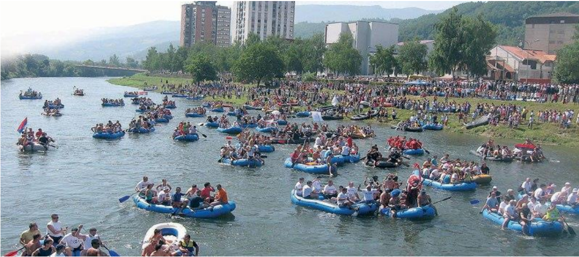
(slika18) Limska Regata.

Greenland festival - održava se svake godine od 24. do 26. jula. Okuplja ljubitelje adrenalinskih sportova kao što su paraglajding, rafting i zip lajn. Uključuje i prateća dešavanja za mlade, kao što su koncerti, predstave i nastupi poznatih Dj-eva.