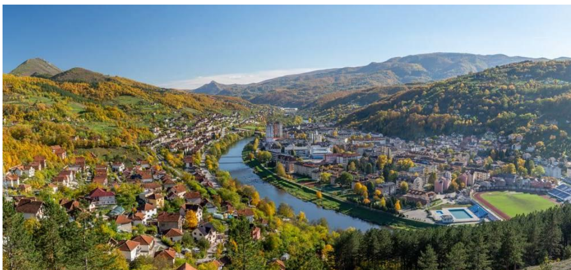
(slika17) Grad Priboj

Dom je njegov u Srbiji, a pružio se i uz granice Crne Gore, Bosne i Hercegovine i Republike Srpske. Pribio se uz obale drevnog Lima okružen prirodnim bogatstvima jugozapadne Srbije. Kroz istoriju, još od doba Nemanjića, pripadao je srpskim zemljama, ali uvek je bio otvoren i za narode drugih vera i konfesija. Većinsko stanovništvo čine Srbi, a oko trećine stanovništva čine bošnjaci i muslimani. Stari Priboj se razvio oko srednjovekovnog trga ispod tvrđave Jagat, dok je novi Priboj počeo da se razvija sa izgradnjom fabrike kamiona, poznate kao „FAP”. Stari Priboj čuva sećanje na dugu i zanimljivu prošlost grada, dok novi Priboj svedoči privrednom razvoju i usponu ovog grada(Slika17). Na prostoru današnjeg Priboja, u oblasti koja se naziva donje Polimlje, ljudi su živeli i u praistorijsko doba. Prve naseobine u ovom području su nastale pre oko 6 milenijuma, a o tome svedoče brojna arheološka nalazišta na ovom području koja pripadaju Vinčanskoj kulturi (Jovanović, 2009). Rudnik Jarmovac koji se nalazi u neposrednoj blizini Priboja, predstavlja jedan od najstarijih rudnika bakra u Evropi.