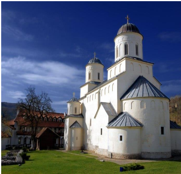
(slika7) Manastir Mileševa.

Jedna od najvažnijih zadužbina srpskog naroda. Podigao ga je kralj Stefan Vladislav u prvoj polovini 13. veka u kojoj je i sam sahranjen. Ovaj manastir predstavlja nepokretno kulturno dobro kao spomenik kulture od izuzetnog značaja (slika7). Freske Mileševe se ubrajaju medju najbolja evropska ostvarenja 13.veka, a od njih najpoznatija je Beli Anđeo (slika8) (zaduzbine-nemanjica.rs).