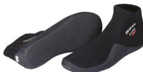
(Slika 14) Neoprenska obuća.

-Obuća (slika14) - Nije obavezan deo opreme ali kao i sa odelima savetuje se da se obuče. Takođe napravljena od neoprena koji štiti stopala od hladnoće.