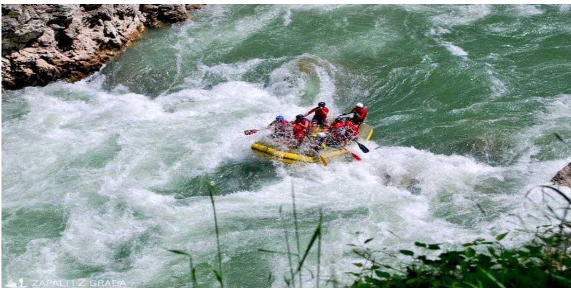
(slika1) Rafting Limom.

Rafting je rekreativna i sportska aktivnost na otvorenom koja koristi splav na naduvavanje za plovidbu rekom ili drugom pokretnom vodom. Primenjuje se na rekama bele vode u prirodnom okruženju i zahteva fizičku veštinu korišćenja vesla i/ili vesla za kontrolu pravca i brzine splava (internationalrafting.com). U Srbiji, rafting je zvaničan sport postao 2006. godine, a ubrzo nakon toga je počela popularizacija raftinga i u komercijalne svrhe. Danas, postoje klubovi koji pored takmičarskog bavljenja ovim sportom, pružaju svoje usluge svim zaljubljenicima u adrenalinske sportove, prirodu, ali i one koji žele da provedu aktivan odmor. Rafting je postao dostupan svima, ali i pored toga on nosi sa sobom odgovornost i rizik. Klub, skiper i članovi koji učestvuju u aktivnostima moraju imati jasnu organizaciju kako na reci tako i na kopnu. Lim kao jedna od reka koja je najatraktivnija za splavarenje pruža nezaboravno iskustvo za sve ljubitelje raftinga(slika 1).