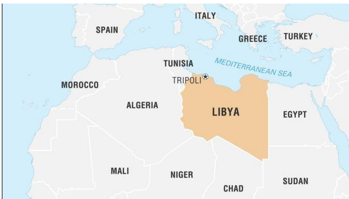
Слика 2. Положај Либије (Buru et al., 2022)

Пре „1951. године када стиче независност, територија данашње Либије била је полунезависна провинција Отоманског царства од 1711. до 1835. године, потом италијанска колонија од 1912. до 1947. године, а од 1943. до 1951. године је била под британском и француском окупацијом“ (Office of the Historian, Foreign Service Institute US, n.d.).