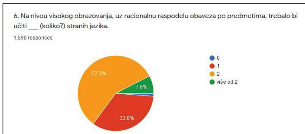
Sl. 3 Stav studenata o broju stranih jezika koje treba učiti na univerzitetu

Pored toga, 214 ispitanika ističe prednosti poznavanja jezika struke u pogledu stručnog usavršavanja i bržeg napredovanja u struci, kao i lakšeg pristupa informacijama, literaturi i istraživačkom radu, npr.: