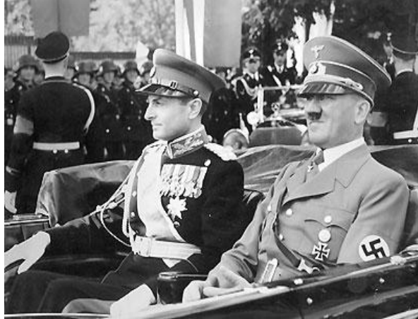
Кнез Павле и Хитлер 36

заstraшивања Немачке, кнез Павле је ипак остао чврст у свом ставу да неће попустити пред Хитлеровим захтевима и додао је да ће Југославија у евентуалном рату покушати да задржи неутралну позицију. 35