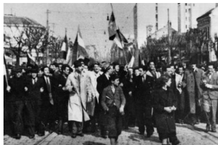
Демонстрације у Београду, 27. марта 1941. године 63