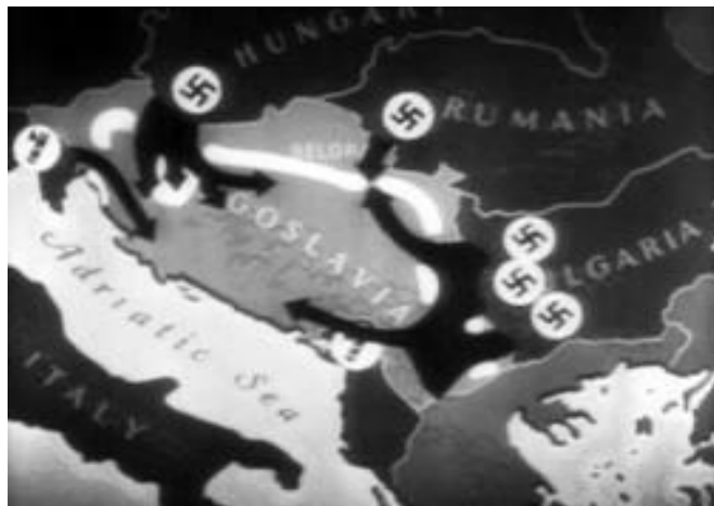
Инвазија Немачке на Југославију 72

Када је сазнао да је свргнута влада која је пришла Тројном пакту, Хитлер је истог дана сазвао седницу својих најближих сарадника и указао да је Југославија овим поступком постала „несигуран фактор“, 70 нарочито имајући у виду предстојеће операције против Грчке и СССР. Хитлер је потом издао наредбу за напад на Југославију, познату као „Директива 25“, у којој се између осталог каже: „Војни пуч у Југославији је изменио политичку ситуацију на Балкану. Југославију треба посматрати као непријатеља и у случају ако да изјаву лојалности, па је стога треба што пре разбити...Чим буду прикупљене довољне снаге и временске прилике допусте, авијација ће даноноћно ваздушним нападима разорити теренску организацију југословенског ваздухопловства и Београд.“ 71