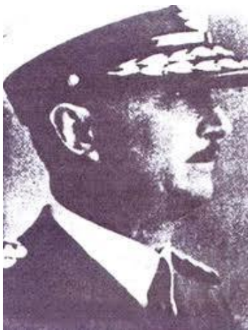
Генерал Душан Симовић 43

Поред официрског кора, и друге организације су имале сличне идеје и међусобно су се повезивале. Српска елита, академски кругови и виђенији српски политичари су се окупљали око Српског културног клуба Слободана Јовановића и већ поменуте тајне организације „Конспирација“. Велику улогу је имала и „Народна одбрана“ Милоша Трифуновића Бирчанина, али и неке друге југословенске групе попут Феријалног савеза и Сокола. Међу српским странкама, јако антиосовинско опредељење било је у Савезу земљорадника, Радикалној странци и Самосталној демократској странци. Чак је и православна црква јавно иступала против фашизма и могућности савезништва са силама Осовине.