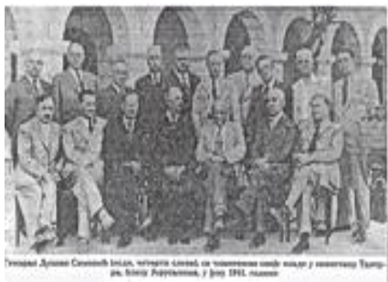
Влада Душана Симиновића 59

За време преврата, кнез Павле се налазио на путу према Словенији како би се на Брду код Крања састао са Мачеком и Корошецом и разговарао о новим хрватским захтевима за изменама у власти. Павлов воз је био заустављен у Загребу, а министар војске генерал Богољуб Илић је наредио команданту Дравске дивизије у Љубљани да саопшти кнезу Павлу да се по наређењу нове владе одмах врати за Београд. Кнез Павле се посаветовао са Мачеком. Он је предложио да заједно крену на Београд и разбију пучисте, али је кнез одбио. Он је прихватио пуч као свршен чин, па је закључио да би позив војсци да стане уз Намесништво био акт побуне против краља. На Мачеков аргумент да се не би радило о побуни, него о покушају „заштите Краља од једне групе неодговорних официра“, Павле је завапио да би то значило започињање грађанског рата, што није долазило у обзир. Наредио је да се воз врати за Београд. Кнез Павле је преко британског конзула у Загребу, упутио молбу британској влади да му интервенцијом код Симиновића олакша одлазак у Грчку и дозволи долазак у Лондон. Док је путовао за Београд, Боривоје Мирковић и његови официри су инсистирали да се кнез стреља, али је та могућност остављена само уколико би кнез одбио да да оставку. На перону га је дочекао генерал Симиновић са неколико официра, како би га спровели на Бели двор, где је потписао оставку, а потом је са породицом преко Грчке интерниран у Африку, као политички затвореник.