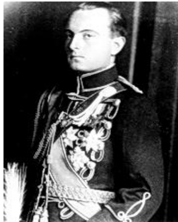
Кнез Павле Карађорђевић 85

Кнез Павле је рехабилитован одлуком Вишег суда у Београду 2011. године и његово име је очишћено љаге коју је носило последњих седамдесет година. Многи историчари и правни теоретичари тврде да је на овај начин исправљена неправда која је нанета Павлу и његовој породици.