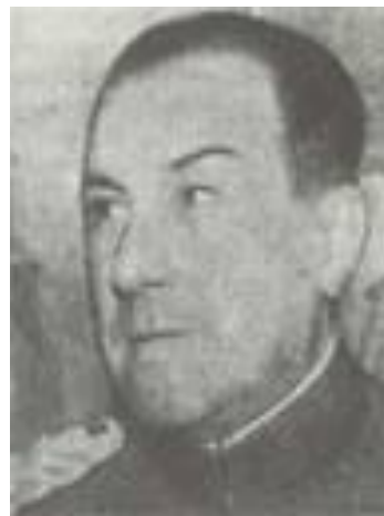
Генерал Боривоје Мирковић 44

Своје намере да покрене пуч, Симовић је најбоље описао у својим мемоарима: „Обузет бригом за будућност нашег народа...услед обрта наше спољне политике у правцу који није одговарао народним осећајима, почео сам размишљати о начину да се одбију насртаји непријатеља, у случају да одговорни фактори не одговоре надама народа, па војска силом околности буде принуђена да узме кормило у своје руке...У том смислу сам водио разговоре са многим официрима, као и армијским генералом Богољубом