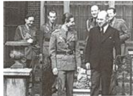
Краљ Петар II са пучистима 60