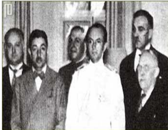
Драгиша Цветковић, кнез Павле и Влатко Мачек након потписивања споразума 23

догађаје. Кнез и Мачек су схватили да само њих двојица могу решити ово питање, јер су ценили један другог и уживали су међусобно поверење. Павле је зато предложио да се склопи један споразум који би решио њихове несугласице, и у наредном периоду организовано је неколико сусрета Мачека и Цветковића, приликом којих су преговарали о условима тог споразума, јер су највећи проблем представљали територијално разграничење и пренос ингеренција. Споразум је коначно постигнут у августу 1939. године, а потписали су га Цветковић и Мачек. Њиме је створена Бановина Хрватска, централизам је требало да се замени федералним уређењем државе, а званично је признато постојање три народа, Срба Хрвата и Словенаца. Спољна политика, одбрана и трговина су остали у ингеренцији државе, а све остале области друштвеног живота су пренете на Бановину. Стварање Бановине, значио је малу победу хрватских сепаратиста, ревизију октроисаног устава и нестанак централистичке Југославије. Након склапања споразума, створена је заједничка влада у коју је ушла и Хрватска сељачка странка.