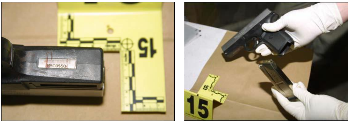
Слика 5. Поступак са ватреним оружјем. Лево: правилно фотографисање ватреног оружја- укључује скалу и идентификациони број; Десно: пример правилног поступања са оружјем пре паковања; (Извор: (NFSTC, 2013))

Трагови ватреног оружја могу се пронаћи на лицу места, на самом ватреном оружју, на жртви и на учиниоцу. „Већина трагова ватреног оружја су видљива и могу се уочити простим визуелним проматрањем и претраживањем лица места, или кориштењем једноставних оптичких помагала (лупа, косо светло). Трагови који потичу од барутних остатака могу бити и невидљиви те се за њихово проналажење и фиксирање морају примењивати специфичне фотографске или хемијске методе. Све трагове пронађене на лицу места (...) треба фиксирати неком од познатих метода (изузимањем, подизањем са подлоге специјалним фолијама или мулажирањем). Видљиве трагове након фотографисања у размери по правилу треба изузимати (чауре, пројектиле, делове пројектила, оружје)“ (НКТЦ, 2015, pp. 503-504).