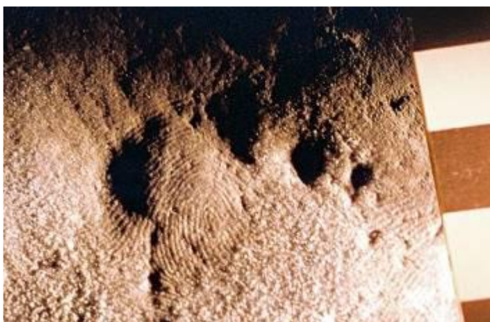
Слика 2. Репродуковање рељефног трага папиларних линија коришћењем косог светла

На месту извршења кривичног дела (тешког) убиства, тако, могу се пронаћи трагови папиларних линија који ће омогућити идентификацију учиниоца. Наиме, трагови папиларних линија веома су важни трагови, с обзиром да имају особине (непроменљивост, индивидуалност и могућност класификације) које их чине незаменљивим у идентификацији и регистрацији лица. Такође, могућност преношења цртежа папиларних линија са особе на неки предмет, као још једна особина ових трагова, има велики оперативни значај, те је у откривању учиниоца управо ова особина кључни фактор (Максимовић, 2000, р. 308).