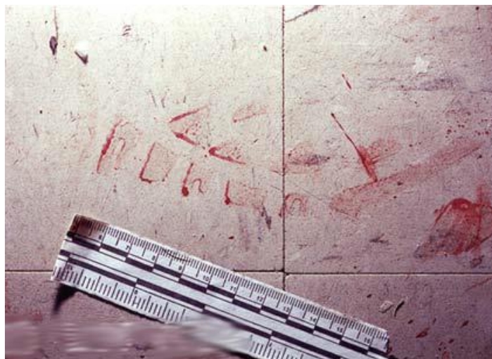
Слика 3. Фотографија трага крви

састругати помоћу ножића у посебну кесицу или епрувету. При том је потребно узети и узорке те површине из непосредне близине, ради упоређивања. Ако се трагови крви налазе на гломазним предметима, треба одсећи део предмета на коме се налази траг, а ако се налазе на лако преносивим предметима, она читаве предмете треба запаковати и доставити на вештачење (Максимовић, Р, & Годорић, У., 2005, рр. 212-215).