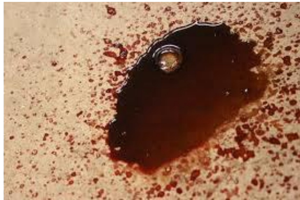
Слика 4. Траг крви у виду локве

У поступању са лешом, лекар судске медицине и криминалистички техничар, траже трагове крви . Уколико постоји нпр. локва крви (слика 4), погрешно је претпоставити да целокупна крв припада само жртви. И нападач је можда претрпео повреду, те је важно да се узорци крви узму са више места. Друга битна ствар код трага крви је облик капи- ово може да укаже на то да ли се жртва у тренутку напада кретала или мировала.