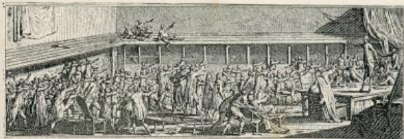
Le Serment du Jeu de Paume.