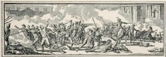
Journée mémorable du 10 Août 1792.