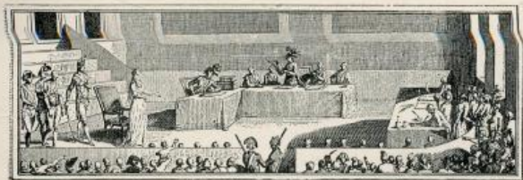
Marie-Jeanne Philippon, femme Roland, Plaidant sa cause devant le Tribunal révolutionnaire le 19 Brumaire an II.