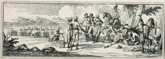
Mort du général Marceau au combat d'Altenkirchen.