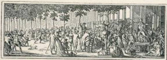
Camille Desmoulins au Palais-Royal.