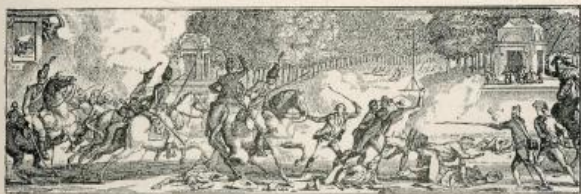
Bustes de M. Necker Portés en triomphe et brisés à la place Louis XV le 12 Juillet 1789.