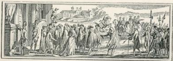
Réponse énergique au Maître des cérémonies.