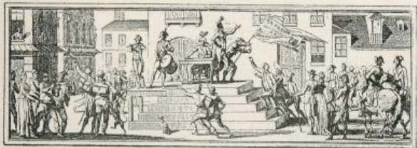
Déclaration de la Patrie en danger.