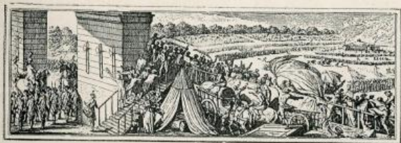
Fédération générale au Champ de Mars le 4 Juillet 1790.