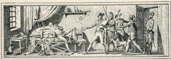
Condorcet se donnant la mort dans sa prison.