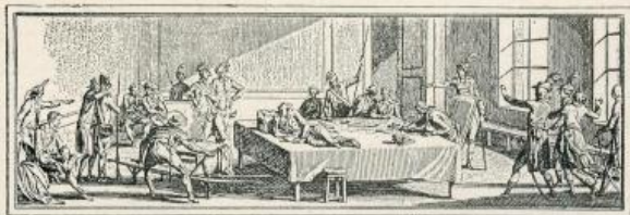
Robespierre dans l'anti-salle du Comité de Salut public Dans la nuit du 9 au 10 Thermidor an II.