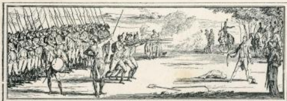
Charette, chef des Vendéens, Fusillé à Nantes, le 9 Germinal an IV.