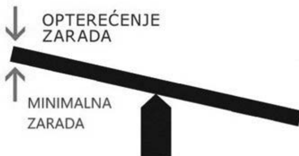
Grafikon 2 – Ilustracija sprovedene reforme u Crnoj Gori

iznosi oko 35% nominalno, ali i u slučaju prosečnih i iznadprosečnih zarada, troškovi poslodavaca porasli su nominalno za oko 8% u proseku. Budući da je međugodišnja stopa inflacije iznosila oko 13% u 2022. godini, možemo zaključiti da je došlo do skromnog realnog smanjenja troškova rada za oko 4% u slučaju prosečnih i iznad prosečnih zarada, ali je trošak za minimalne zarade povećan za preko 20% u realnom iznosu. Visoko povećanje troškova za minimalnu zaradu pravdano je čestom praksom prijavljivanja radnika na minimalnu zaradu i isplaćivanja dodatnih neprijavljenih prihoda „na ruke“. Iako je ova praksa nesporno prisutna u velikoj meri u Crnoj Gori, kao i u Srbiji, činjenica je da deo poslodavaca, naročito u manje razvijenim sektorima i delovima zemlje, nije bio u mogućnosti da radnicima isplaćuje dodatna primanja „na ruke“, te je u njihovom slučaju došlo do osetnog povećanja stvarnih troškova zarada.