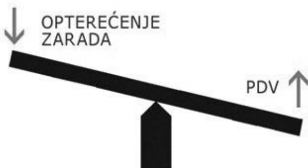
Grafikon 1 – Ilustracija predložene reforme u Srbiji

Reformski nacrt razrađen u studiji Poreska politika u Srbiji – pogled unapred (Arsić i dr, 2010) predviđao je da se poresko rasterećenje zarada dominantno ostvari ukidanjem doprinosa za zdravstveno osiguranje. Odluka je pala na doprinose za zdravstvo jer je porez na zarade ionako nizak, dok penzijski doprinosi predstavljaju ključni izvor finansiranja državnog penzijskog osiguranja. Sa druge strane, zdravstvo u Srbiji suštinski ne funkcioniše po (Bizmarkovom) sistemu osiguranja jer plaćanje zdravstvenih doprinosa ne omogućava osiguranicima da se leče u privatnim ustanovama, već samo u državnim. Pri tom, oko 98% građana ima pravo korišćenja javnog zdravstva (plaćanjem doprinosa, ili preko sistema socijalne zaštite), tako da sistem u praksi više odgovara (Beveridžovom) modelu javne zdravstvene zaštite gde je finansiranje moguće organizovati i direktno putem poreza umesto kroz zasebne doprinose za zdravstvo.