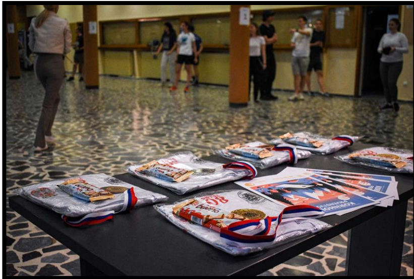
Слика 18. Медаље и награде за најбоље међу студентима