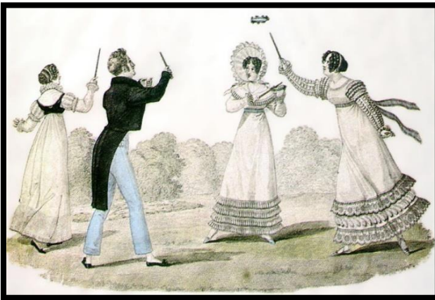
Слика 3. игра „Потковице“

величине, које су одређивале различите вредности поена, и обезбедила је сваком играчу по једну већу торбу по рунди, којом је могло да се постигну двоструки поени.