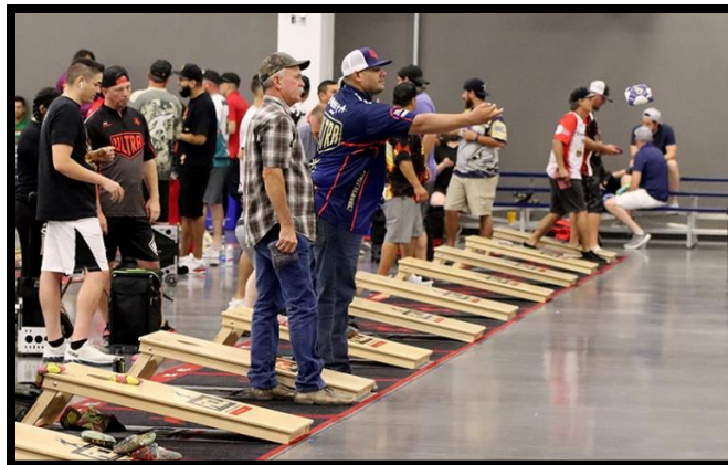
Слика 10. Турнир у корнхолу у затвореном простору