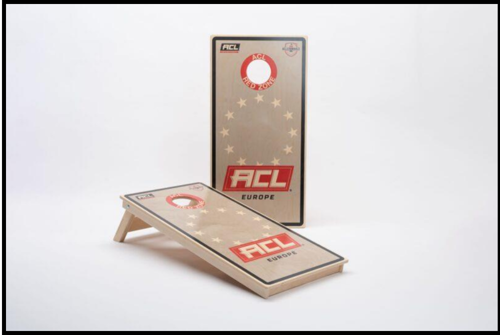
Слика 13. Званични АКЛ Европа сет табли за корнхол 120х60 цм који се користи у Србији