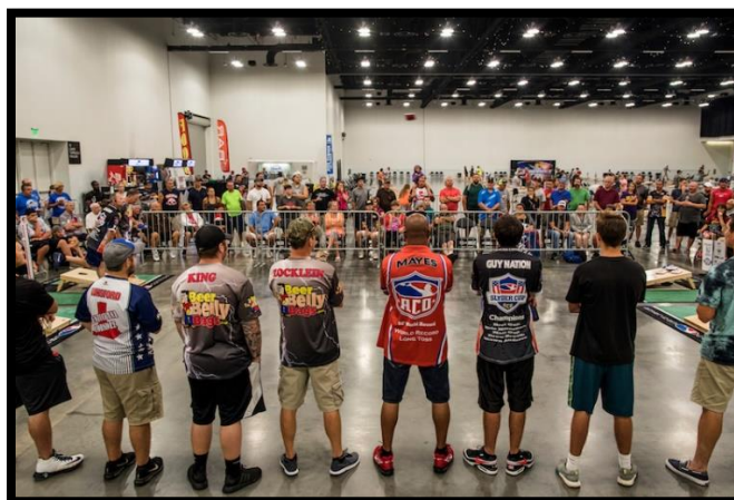
Слика 11. Професионални корнхол турнир