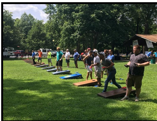
Слика 12. Корнхол турнир на отвореном