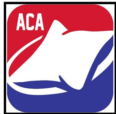
Слика 9. Лого америчке корнхол асоцијације