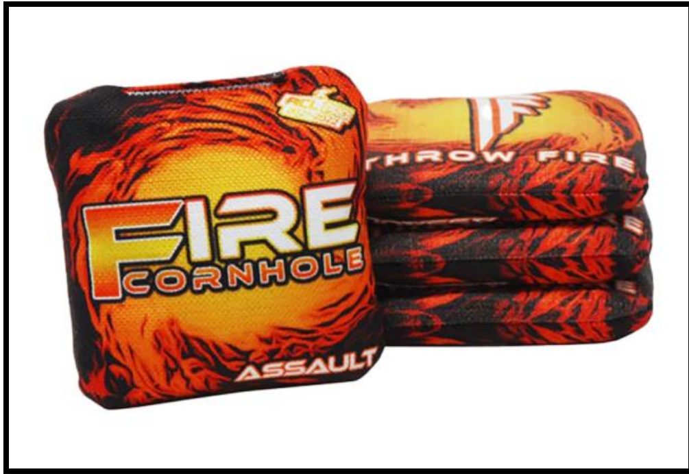
Слика 14. Професионалне корнхол врећице, Корнхол Србија