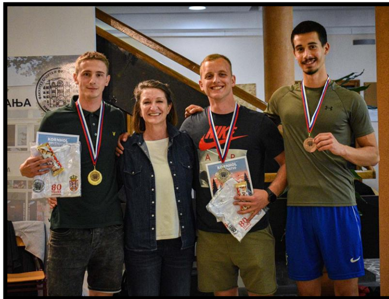
Слика 21. Највештији студенти са директором такмичења