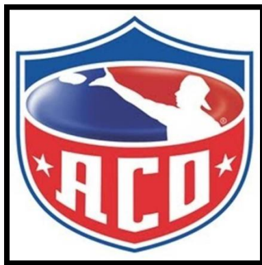
Слика 7. Лого америчке корнхол организације

Америчка корнхол асоцијација (АКА) (Слика 9.) је организација чија је једина мисија да помогне играчима корнхола да уживају у корнхолу, а као један од најважнијих начина да се постигне овај циљ је да играчи имају квалитетну опрему за игру. Сходно томе, АКА је у великој мери фокусирана на продају квалитетних производа и опреме за корнхол, али такође и спонзорише догађаје битне за овај спорт. (Слике 10,11,12.)