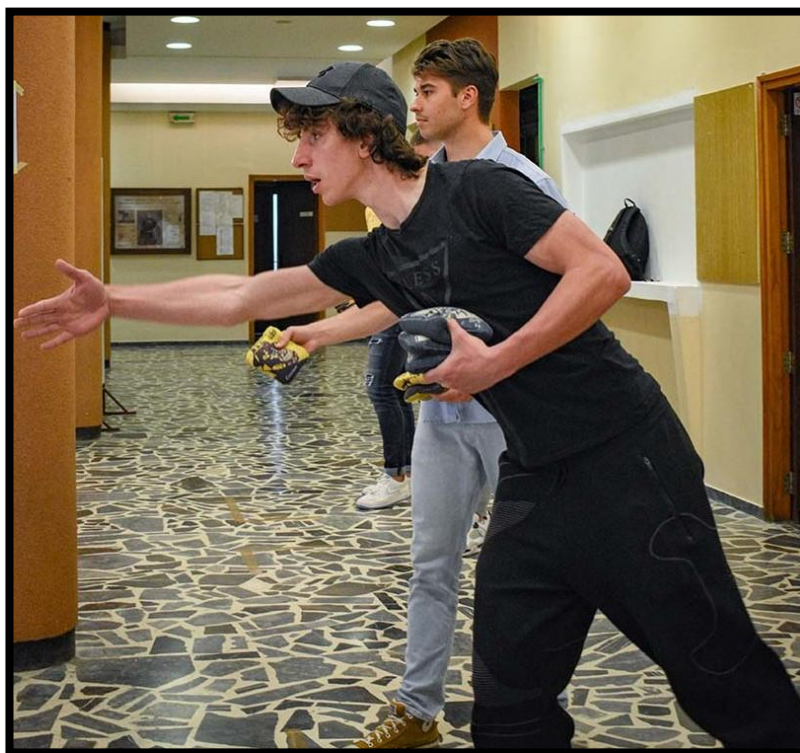
Слика 19. Студенти у току меча