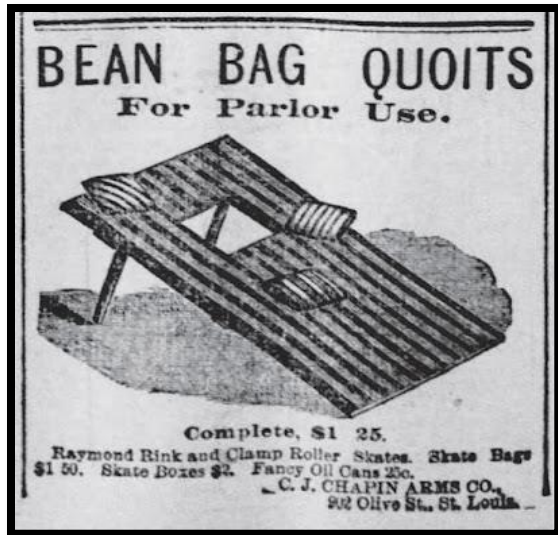
Слика 5. Оглас у новинама за продају табле за игру „Бин-бег“