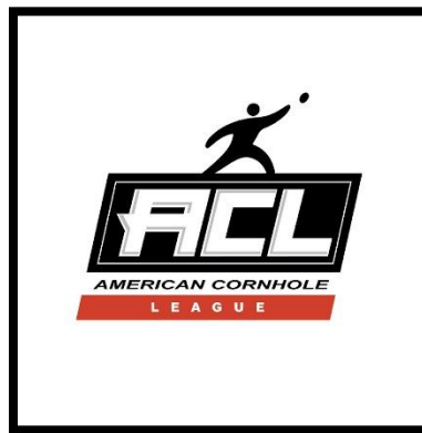
Слика 8. Лого америчке корнхол лиге