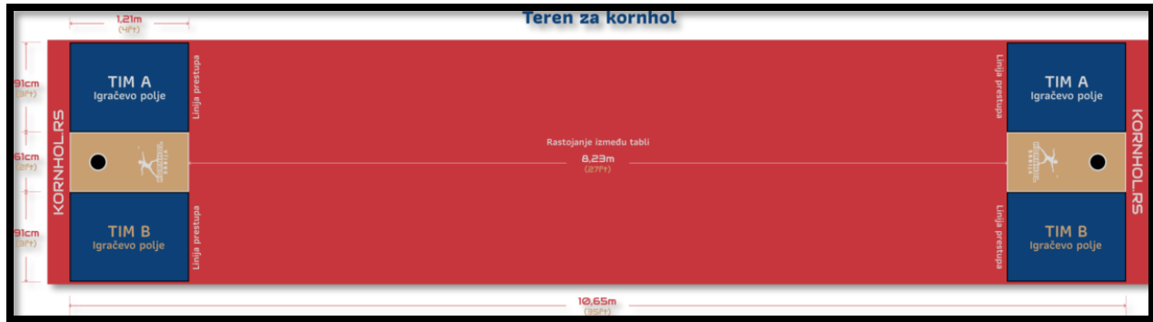
Слика 15. Терен за корнхол