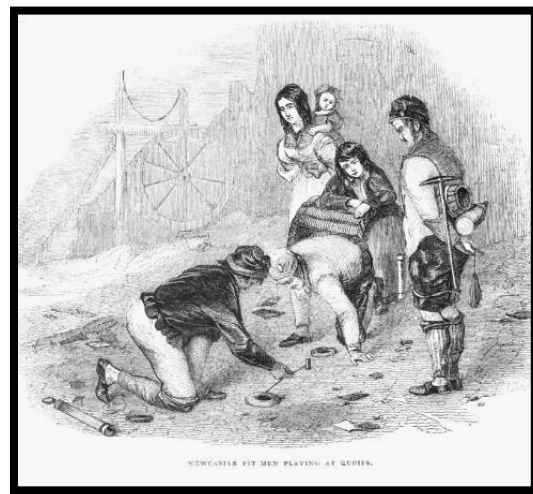
Слика 2. игра „Квоитс“

Он је продао права на игру произвођачу играчака из Масачусетса који је пласирао њену верзију под именом „ Фаба Бага “. (Слика 4.) За разлику од модерног корнхола која има једну рупу и једну величину врећица, „Фаба Бага“ плоча је имала две рупе различите