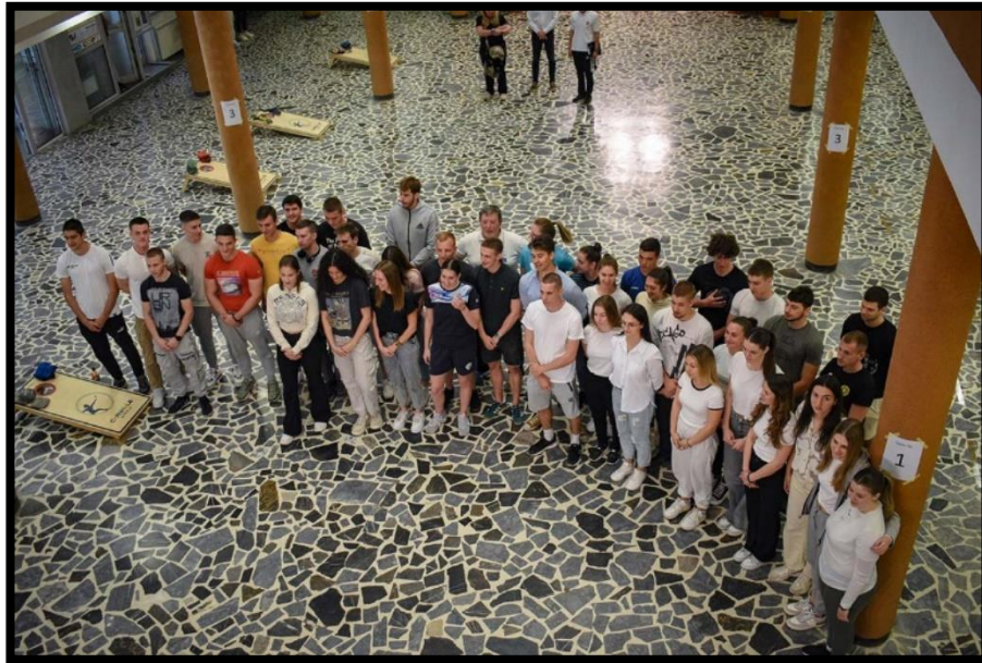
Слика 17. Интонирање химне пре почетка такмичења

Укупно 70 студената је учествовало у овом спортском догађају, 42 студената и 28 студенткиња, демонстрирајући своје вештине у бацању врећица ка циљу. Атмосфера је била пуна узбуђења и спортског духа, а пре самог такмичења интонирана је и химна. (Слика 17.)