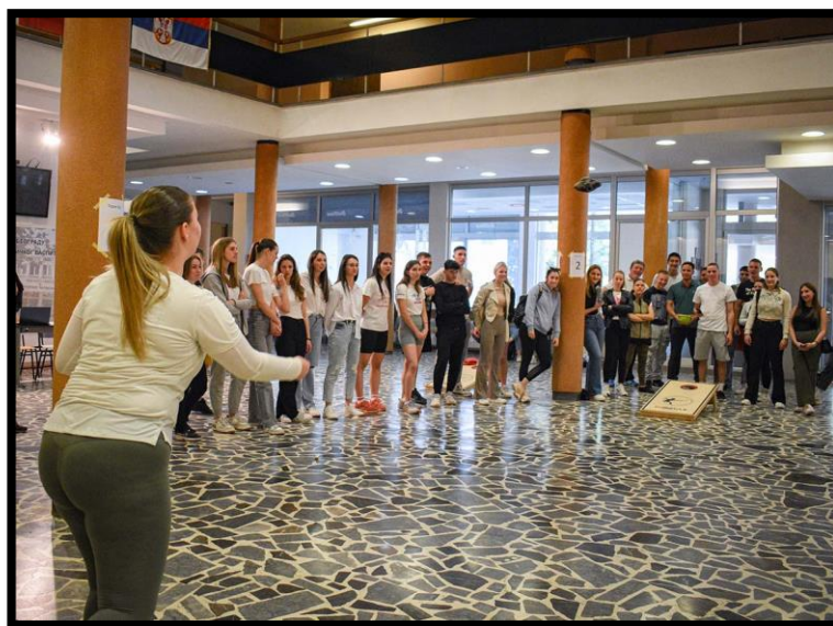
Слика 16. Подришка навијача студентима у току меча

На Факултету спорта и физичког васпитања у априлу ове године, у сарадњи са организацијом „Корнхол Србија“ и студентима треће године, у склопу њиховог практичног дела испита на предмету Менаџмент у спорту, организовали смо турнир у корнхолу за студенте ФСФВ-а. Турнир је био одржан у четвртак 11. априла 2024 године у холу Факултета, а пре самог турнира била је организована и промоција корнхола за студенте која се одвијала на истом месту током три дана од 8. до 10. априла. Посећеност промоцији корнхола и заинтересованост студената је била веома изражена, што је касније резултирало веома занимљивим и узбуђујућим мечевима на целом турниру. (Слика 16.)