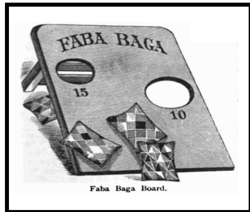
Слика 4. табла за игру „Фаба Бага“

У септембру 1974. године, часопис „ Popular Mechanics “ објавио је чланак који је написала Керолин Фарел о сличној игри под називом "бин-бег булс ај". Ова игра се играла на табли исте ширине модерних корнхол табли 24 инча / 60 цм, али само 36 инча / 90 цм по дужини за разлику од 48 инча / 120 цм дужине табле која се користи у корнхолу. Рупа је била истог пречника 6 инча / 15 цм, али је центрирана на 8 инча / 20 цм, а не 9 инча / 23 цм са задње стране плоче као што је на модерним таблама. (Слика 5.)