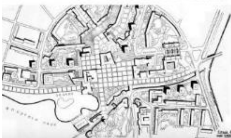
Slika 7 Projektna šema 4, gradskog centra Novog Pazara, T.Milovanović i A.Čorović (iz elaborata)