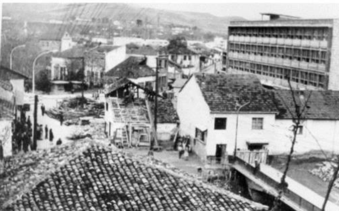
Slike 1 i 2 Odnos novosagrađenih objekata i starih objekata namenjenih rušenju (Gore: Hotel Vrbak, Dole: Dom kulture sa Radničkim univerzitetom)