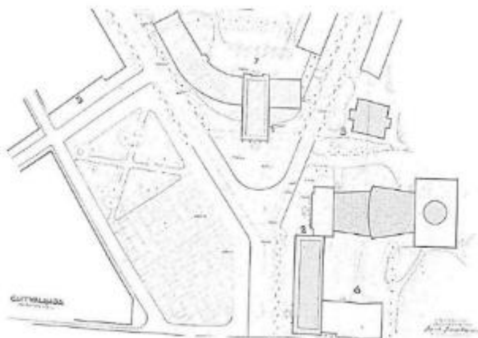
Slika 4 Projektna šema 1, gradskog centra Novog Pazara. T.Milovanović i A.Ćorović (Iz elaborata)