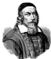
Jan Amos Komenski (1592-1670)