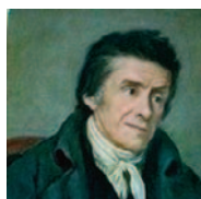
Johan H. Pestaloci (1746-1827)