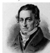
Johan F. Herbart (1776-1841)