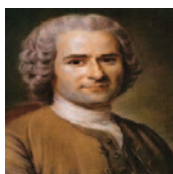
Žan Žak Ruso (1712-1778)