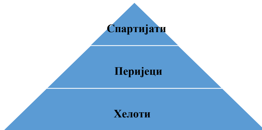
Слика 1. Пирамида спартанског друштва 9

Спарта је по много чему била другачија од осталих полиса, за разлику од Атене јер је у Спарти била успостављена владавина имућнијих, односно олигархије. Такође, била је једини полис у Грчкој где се очувао облик краљевства у којем су власти краља сведене на репрезентативном и церемонијалном нивоу. У Спарти је главни циљ живота био смањити осећај вредности материјалног и повећати осећај вредности оног што су сматрали највреднијим, а то су људске врлине 8 .