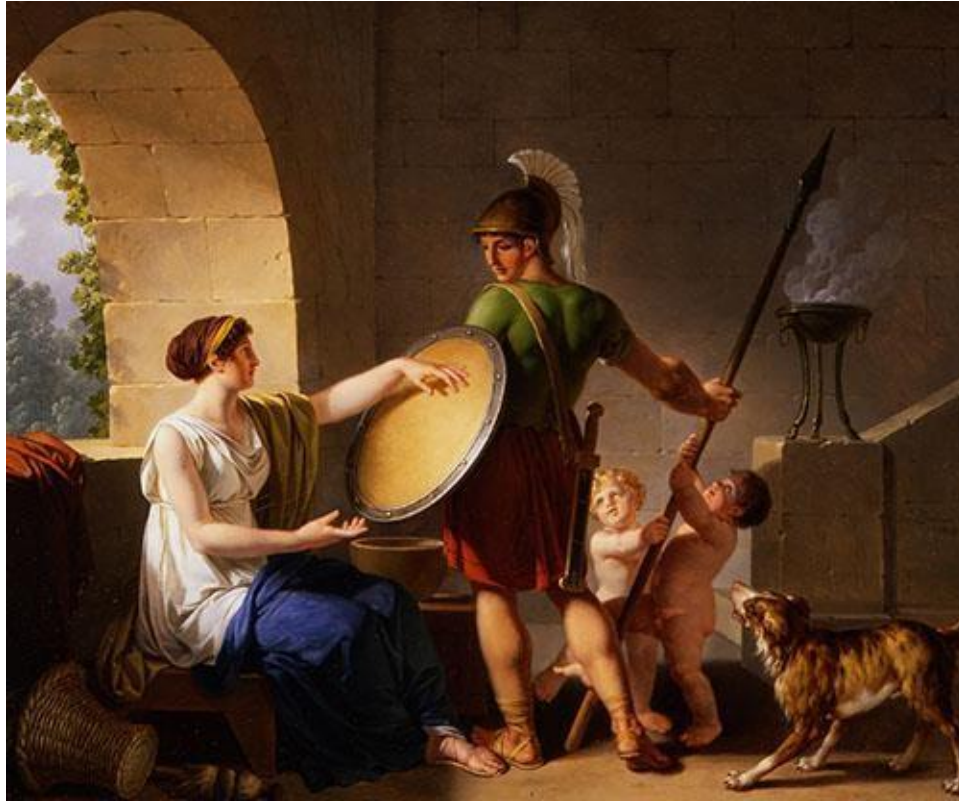
Слика 4. Спартанска мајка даје штит сину 49

Васпитање девојчица такође је био строг и напоран. И оне су биле дужне да изводе гимнастику и упознају се са ратним вештинама како би, ако устреба, могле бранити Спарту. Ипак, за разлику од дечака, нису боравиле у логорима него код куће. Девојчице нису касније ишлени у војску 50 .