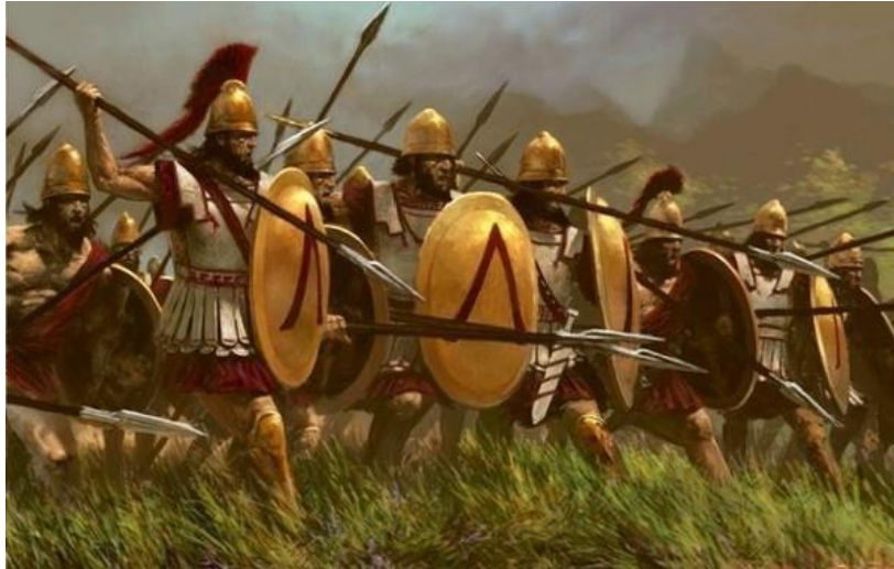
Слика 2. Спартански војници 30

смањити осећај вредности материјалног и повећати осећај вредности онога што су они сматрали највреднијим – људска врлина.